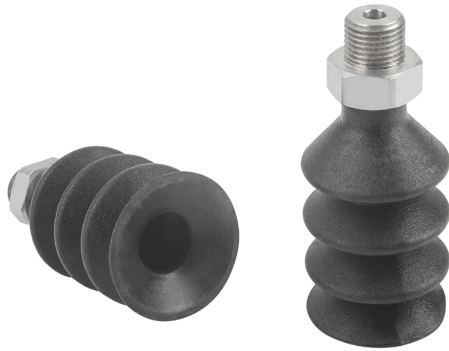
Ventose a soffiutto FSGB (3,5 pieghe)